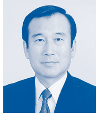
秋葉 忠利 あきばただとし 広島市長・平和市長会議会長 1942年 東京生まれ 1970年 マサチューセッツ工科大 大学院博士課程修了 タフツ大学准教授、衆議院議員等歴任 1999年より広島市長

この流れをさらに強め、核兵器のない世界の実現に向け、地域から大きな連帯の輪をつくりましょう。